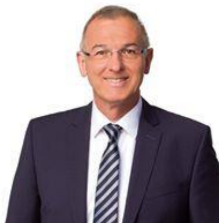
Wolfgang Hauber, MdL Innenpolitischer Sprecher

das Jahr 2019 begann mit der traditionellen Winterklausur-Tagung der FREIEN WÄHLER , dieses Mal vom 9.- 11. Januar in Straubing. Hier hatten wir in unseren Gesprächen und Diskussionen mehrere landespolitisch bedeutende Schwerpunkte auf der Tagesordnung: Die Zukunft der Automobilindustrie , die berufliche Bildung und die Förderung erneuerbarer Energien . Besonderes Augenmerk haben wir außerdem auf den Umwelt- und Klimaschutz sowie auf die Bewahrung unserer natürlichen Ressourcen gelegt. Bei Besuchen im Kompetenzzentrum für Nachwachsende Rohstoffe in Straubing und im BMW-Group Werk in Dingolfing informierten wir uns über Alternativen zu fossilen Energieträgern und die Möglichkeiten nicht-fossiler Antriebssysteme.