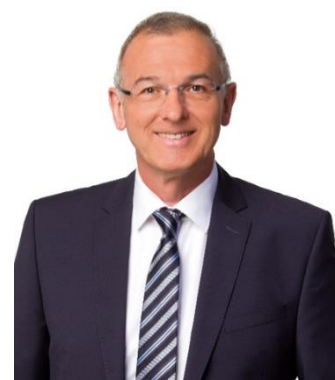
Wolfgang Hauber, MdL Innenpolitischer Sprecher

die aktuelle Corona-Pandemie stellt unsere Gesellschaft vor große Herausforderungen. Wir befinden uns in einem historischen Ausnahmezustand, der offenbart, aus welchem Holz eine Regierung geschnitzt ist. In diesen Zeiten gilt es noch mehr als sonst, beherzt und unerschrocken zu handeln – das haben die Bayerische Staatsregierung und die Regierungskoalitionen aus FREIEN WÄHLERN und CSU getan. Zum Schutz der Bevölkerung haben wir ein umfassendes Maßnahmenpaket beschlossen, das auf drei Säulen fußt: Eindämmung der Ausbreitung des neuartigen Coronavirus, Sicherstellung der medizinischen Versorgung und Unterstützung der heimischen Wirtschaft. Priorität muss es haben, die bayerische Bevölkerung vor einem weiteren sprunghaften Anstieg der Infektionen zu schützen. Das erreichen wir nur durch eine gezielte Beschränkung des öffentlichen Lebens. Aber auch wenn wir davon ausgehen, dass die ergriffenen Maßnahmen dazu beitragen werden, die Ausbreitung zu verlangsamen, werden die Fallzahlen in den nächsten Tagen und Wochen drastisch steigen. Unser Gesundheitssystem ist hierfür, auch dank unserer Nachjustierungen, gewappnet. Und mit unserem Rettungsschirm für die bayerische Wirtschaft stellen wir die Liquidität unserer Betriebe bereits heute für die Zukunft sicher. Dieses Maßnahmenpaket ist im wahrsten Sinne NOTwendig, denn es wird – wenn jeder Einzelne bereit ist, sein Leben den derzeitigen Umständen anzupassen – viele Leben retten.